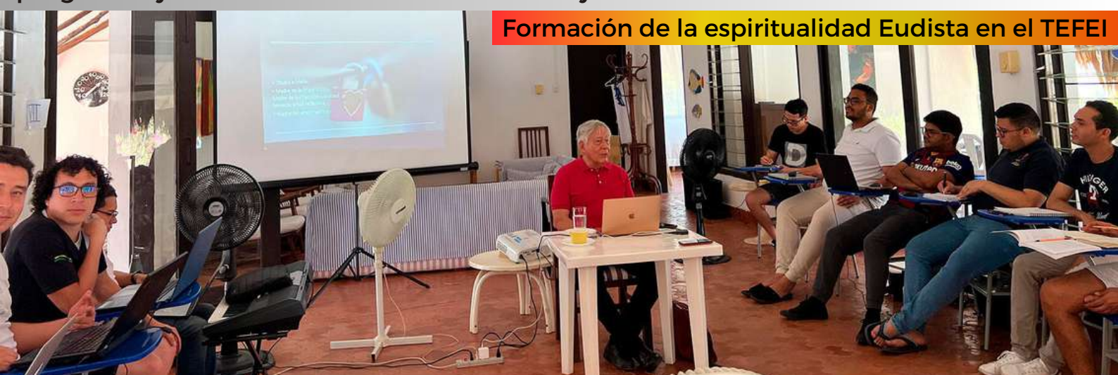
Formación de la espiritualidad Eudista en el TEFEL

2. Diálogo fundamentado: Pero esta comprensión no se limita solo desde los puntos de encuentro, sino que el acento eudista lo presenta desde la necesidad de un anuncio fundamentado que comprenda el momento histórico. “El diálogo con la sociedad que supone la evangelización, implica una seria fundamentación del propio anuncio y la capacidad de comprender el pensamiento de cada momento histórico.” El mismo anuncio kerygmático debe presentarse actualizado en las preguntas y necesidades del hombre de hoy.