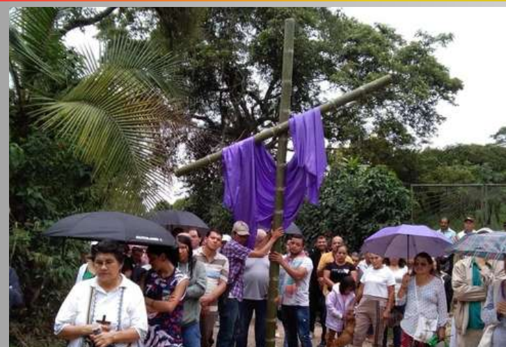
Al realizar el Viacrucis en la vereda Anatolí, en La Gran Vía en Cundinamarca los candidatos del TEFEI, manifestaron que en la cruz encontramos la redención, en nuestra misión encontramos su extensión.