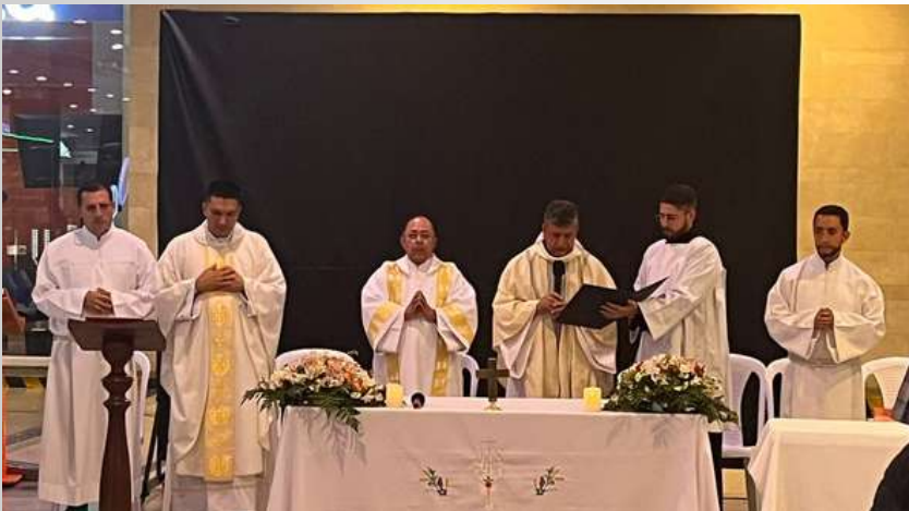
En la parroquia San Lucas Evangelista se compartió una misión de Semana Santa donde todos juntos, como comunidad, somos testigos del sacrificio y la esperanza en Jesucristo nuestro Salvador