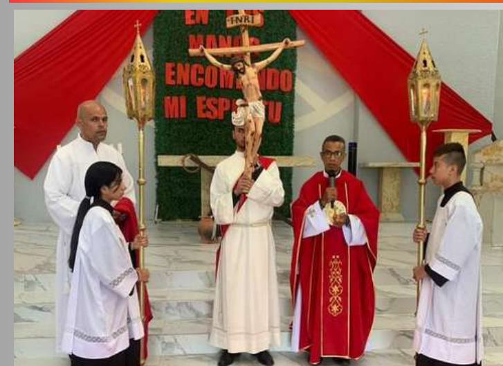
En la parroquia San Juan María Vianney en Bucaramanga, se experimentó una misión donde cada acto de servicio, renovamos nuestro compromiso con el mensaje de la cruz