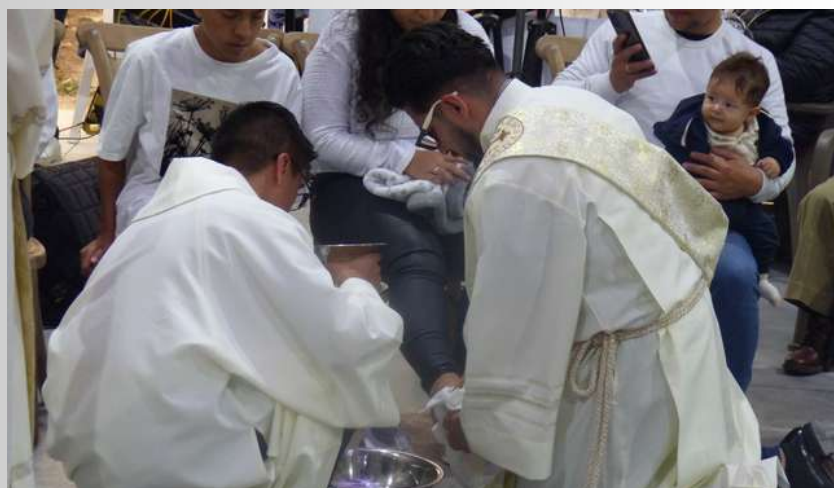
En la parroquia San Juan Eudes en Ciudad Verde en Soacha, fue una semana llena de servicio y entrega. Desde nuestras acciones durante esta misión reflejaron la compasión y el amor de Cristo