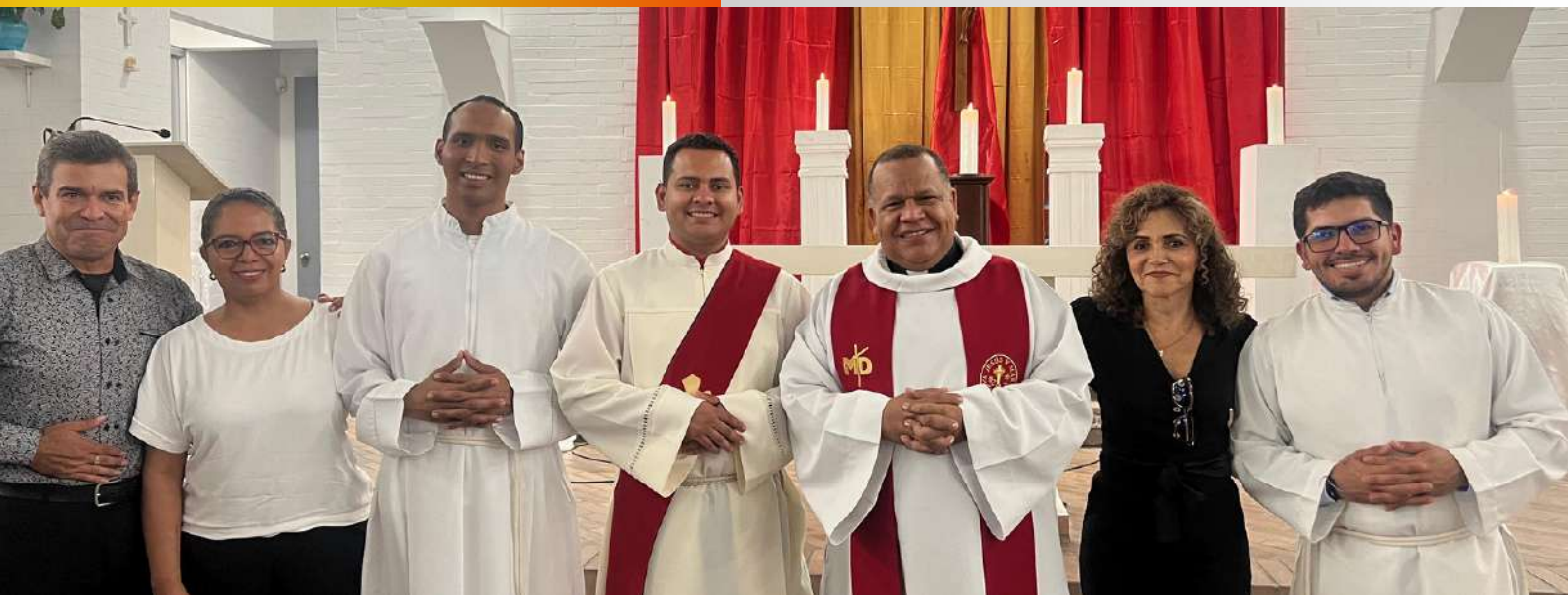
En la parroquia San Juan Eudes en Villavicencio, se vivió una Semana Santa desde el llamado a renovar nuestra fe , servir con amor y con alegría se compartieron momentos de fraternidad